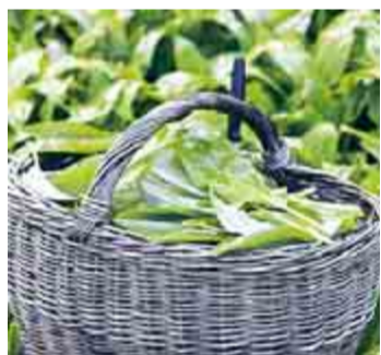
Vom Bärlauch werden vorwiegend die frischen Blätter genutzt.

Die Gnocchi in leicht kochendes Salzwasser geben und etwa fünf Minuten garen lassen. Dann herausheben, etwas abtropfen lassen und in zerlassener Butter in der Pfanne kurz anbraten. Mit frisch gehobeltem Parmesan bestreuen und sofort servieren. Dazu passt ein gemischter Salat. (ct)