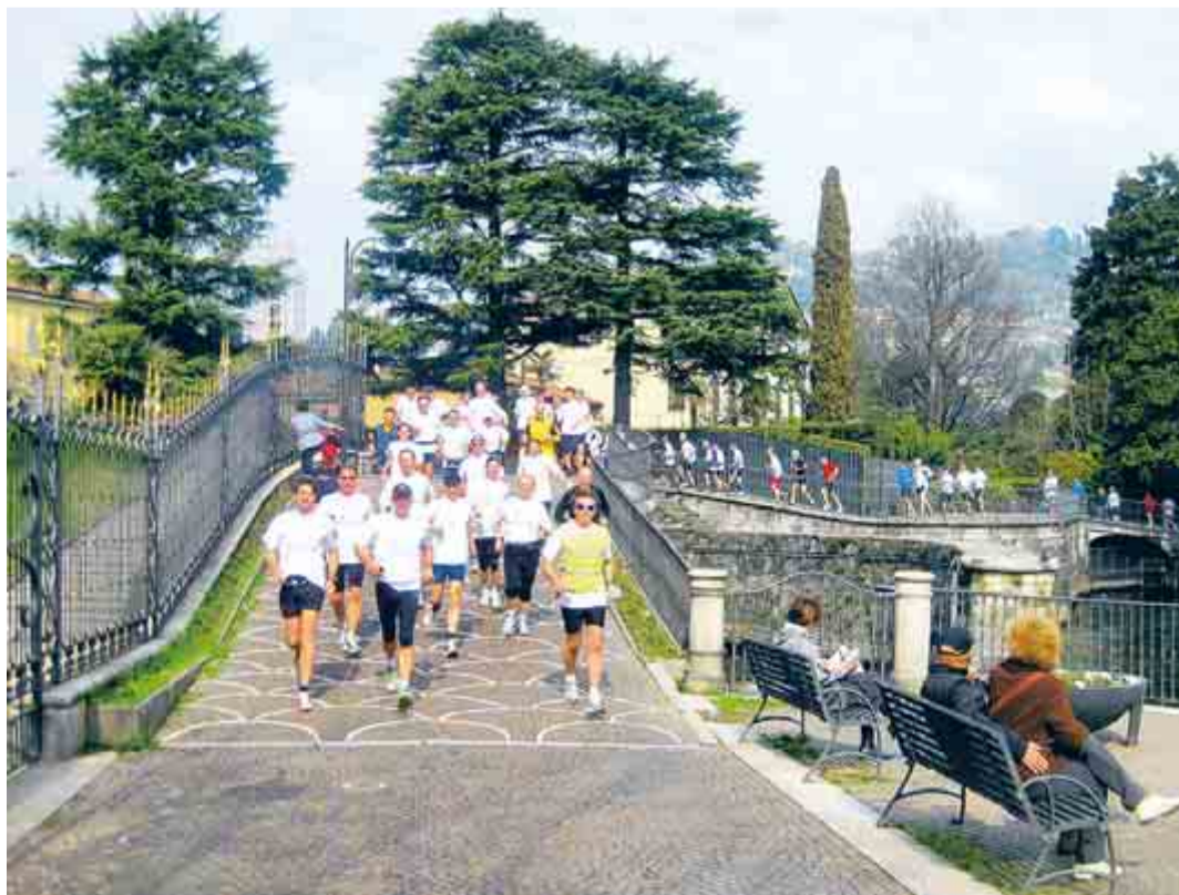
Der „Hiddenrun“ führte am Comer See vorbei an Villen und historischen Gebäuden. Dieser Streckenschnitt, die Passeggiata di Villa Olmo, liegt zwischen der Villa Olmo und dem Hafen von Como.

Der Therapievorschlag kam vom Kinderarzt seiner Tochter, der jeden Sonntag durch den Königsforst lief. „Anfangen habe ich mit vier, fünf Kilometern“, sagt Häger, „im Oktober 2004 bin ich meinen ersten Köln-Marathon gelaufen – da war ich 50.“ Seither hat er keinen ausgelassen. Der Hiddenrun jedoch übt eine besondere